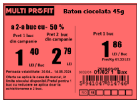
Etichetă raft 70x50