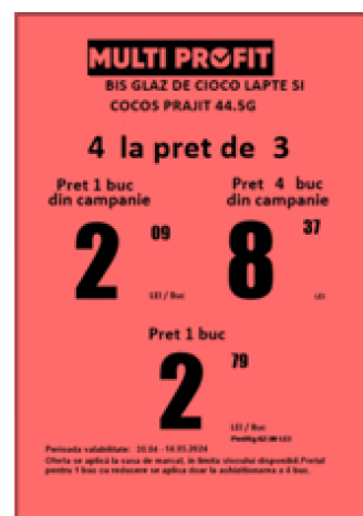
Afiș A4 Portret