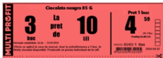
Etichetă raft 150x50