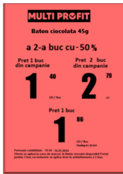
Afiș A4 Portret