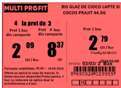
Etichetă raft 70x50