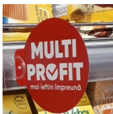
Wobler Multi Profit