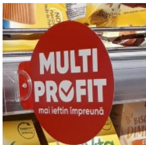
Wobler Multi Profit