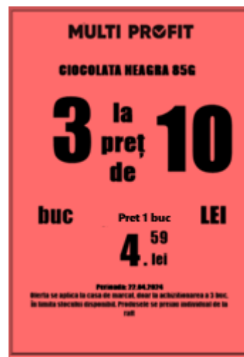
Afiș A4 Portret